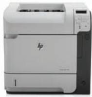
HP LaserJet Enterprise 600 M602n