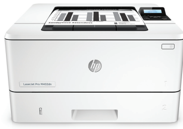
HP LaserJet Pro M402dn

Tulostussuorituskykyä ja tehokasta tietoturvaa työtapoihisi sopien. Tämä suorituskykyinen tulostin tulostaa työt nopeammin ja suojaa kattavasti tietokonetta uhkia vastaan. Alkuperäiset HP-värikasetit ja JetIntelligence tuottavat enemmän tulosteita. 2