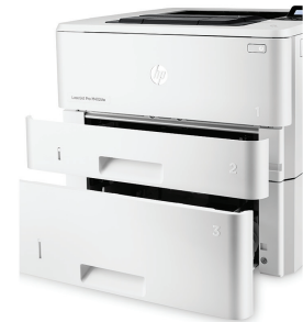
HP LaserJet Pro M402dn valinnaisella 550 arkin alustalla