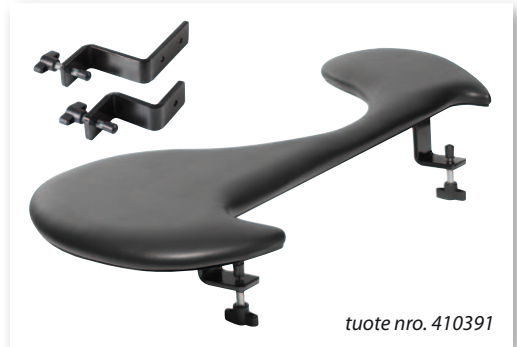
tuote nro. 410391