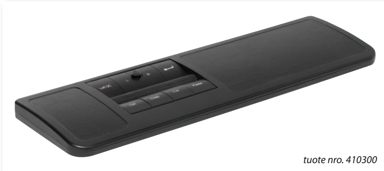
tuote nro. 410300