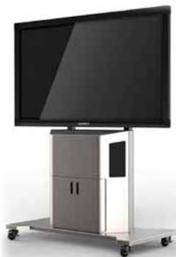
Jalusta ST10 Näyttökoot 55"-70"