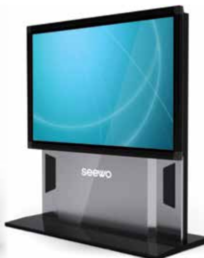
Jalusta ST07 Näyttökoko 80"