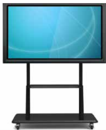
Jalusta ST01 Näyttökoot 42"-70"