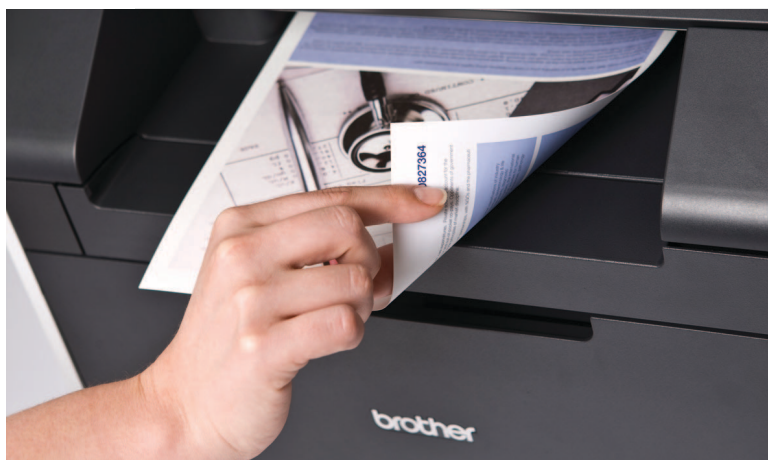
Korkealaatuiset ammattitulosteet kaksipuoleisina - automaattisesti!