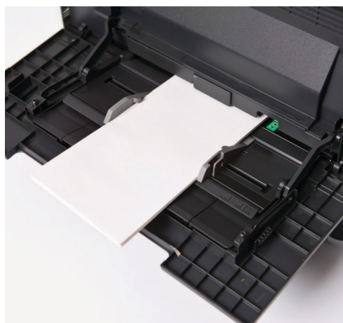
Tulosta kirjekuorille ja paksulle paperille käyttäen monitoimialustaa.

SSL (Secure Socket Layer)-salaisuus. Asiakirjan kulku verkon yli tulostimeen kestää vain sekunnin, mutta sekin on tarpeeksi pitkä aika, jotta hakkerit pystyvät kopioimaan sen. SSL-suojaus estää kopiointiin salakirjoittamalla työn siksi aikaa, kun se kulkee verkon yli, varmistaen, että luottamukselliset tiedot pysyvät luottamuksellisina.