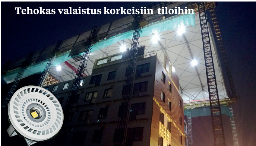
Tehokas valaistus korkeisiin tiloihin